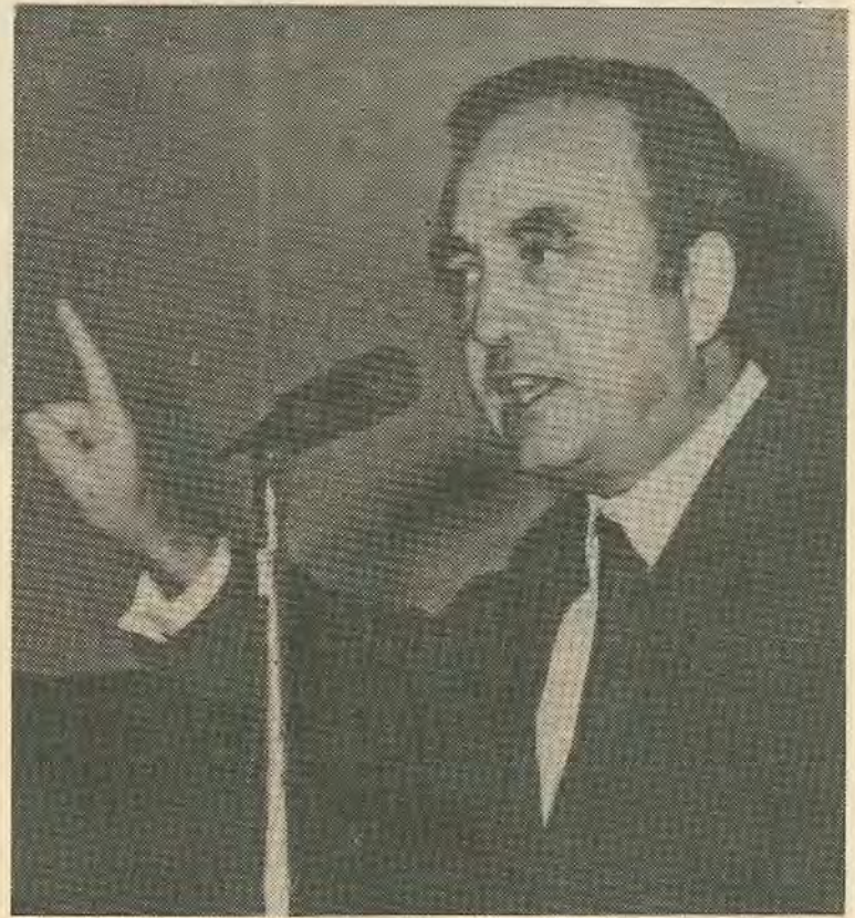
προσφέρει την σωστή πορεία τηρη στις θλιβερές κραυγές αποτελεί την καλύτερη απάντηση για «ενότητα της Δεξιάς».

Οι θέσεις της ΕΔΕΚ είναι γνωστές. Η λεπτομερειακή παρουσίαση ενός προγράμματος θα αποτελέσει την πρακτική απόδειξη της τοποθέτησης του κόμματος. Η επίτευξη ενός κοινού προγράμματος των αντιιμπεριαλιστικών δυνάμεων, ενός προγράμματος που να